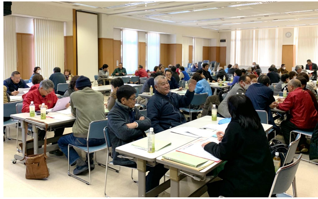
山城地区 小地域ネットワーク合同連絡会

新型コロナウイルスの影響で、残念ながら中止になってしまった事業もたくさんありました(T_T)