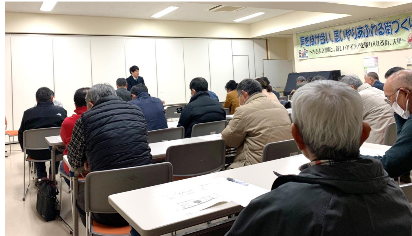
大里地区 福祉推進員研修会