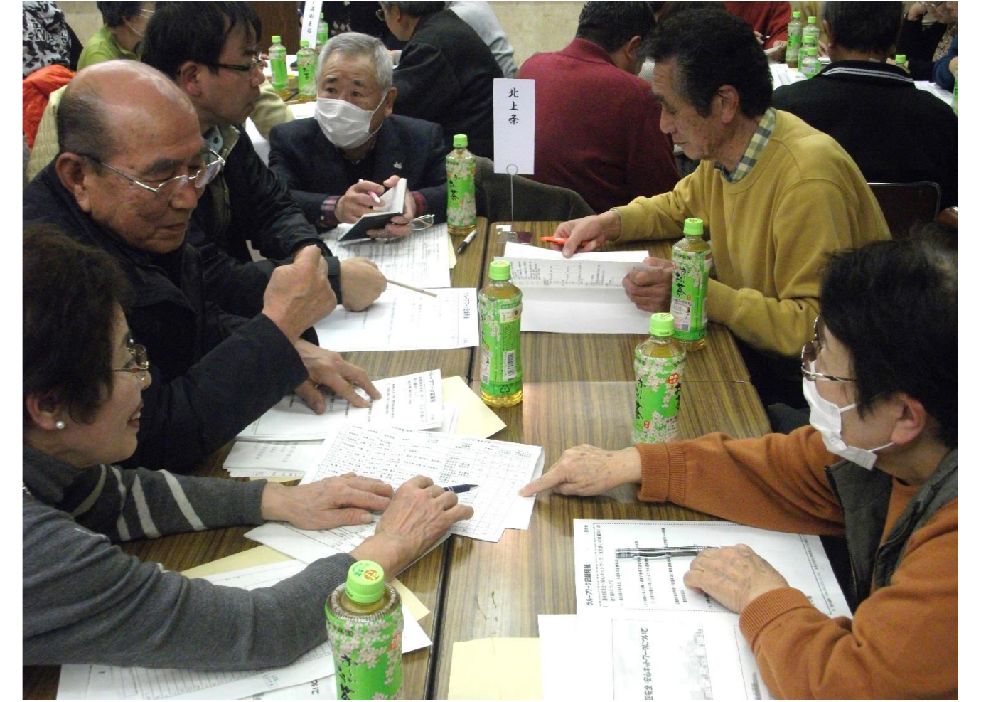
国母地区 福祉合同研修会