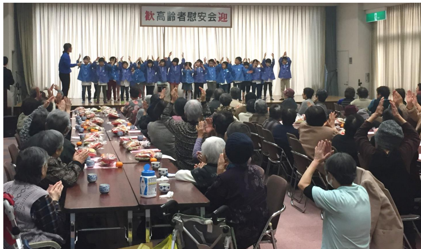
中道地区 高齢者慰安会