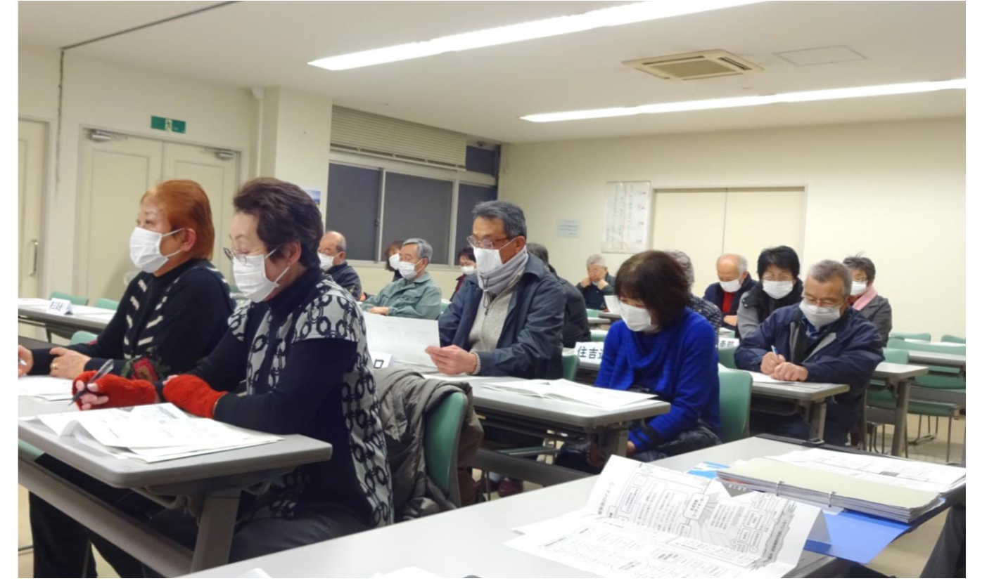
湯田地区 三団体合同会議