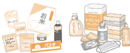
【フードアプリケーションプラス】