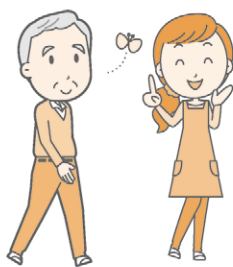
【ボランティアの派遣】