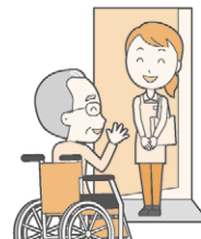
【小地域ネットワーク活動】

ひとり暮らしの高齢者等、地域の中で孤立しがちな方に声を掛けて、顔の見える関係を作ります