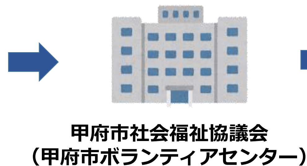
甲府市社会福祉協議会 (甲府市ボランティアセンター)