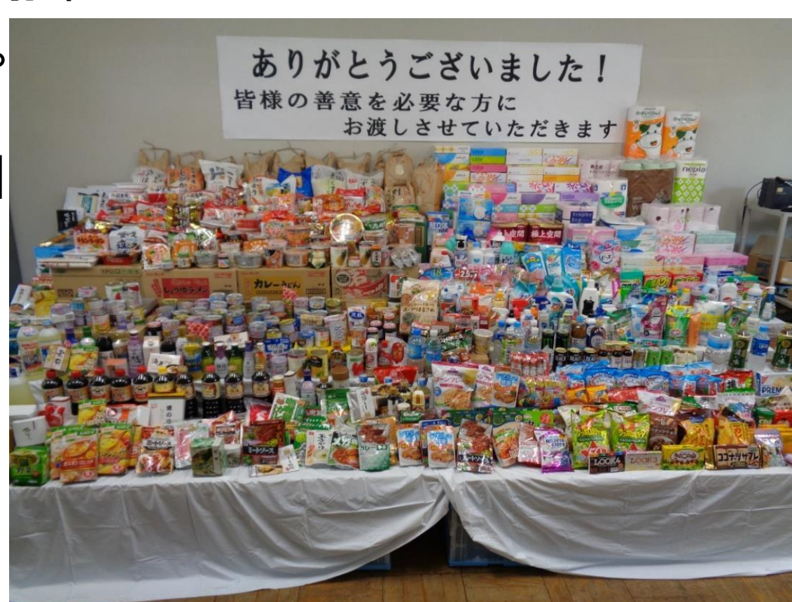
(写真はご寄付いただいた食品と生活用品の一部です)

※11月下旬に本年度2回目の同取組を行います。詳しくは、裏面の記事をご覧ください。