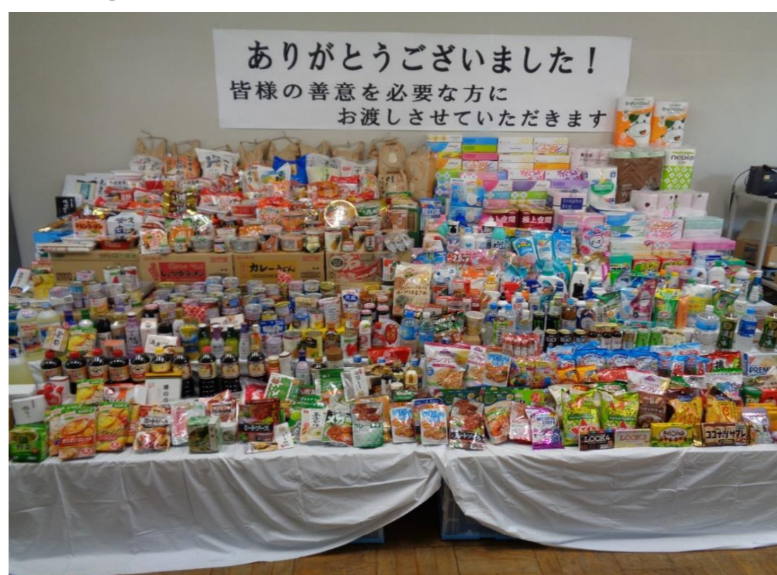
(写真はご寄付いただいた食品と生活用品の一部です)