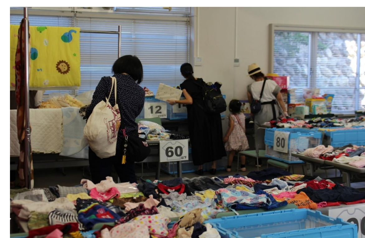
（写真は、昨年度に開催した「おゆずり会」の様子です。）

○譲渡物品：就学前（0～6歳）の乳幼児が使用する物品 服（130cmまで）、帽子、靴（19cmまで） 下着（未使用）、紙オムツ（未開封） 子ども用寝具、ベビーソファ など