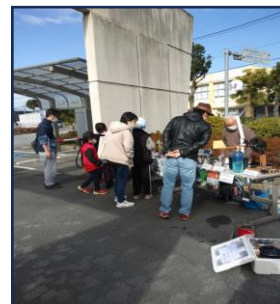
2023年11月26日 甲府市リサイクルプラザでの再エネワークショップの様子

活動内容 ・市民立共同発電所の設立 ・自然エネルギーの調査研究 ・自然エネルギーに関する普及啓発活動 ・環境教育プログラムの地域での実践