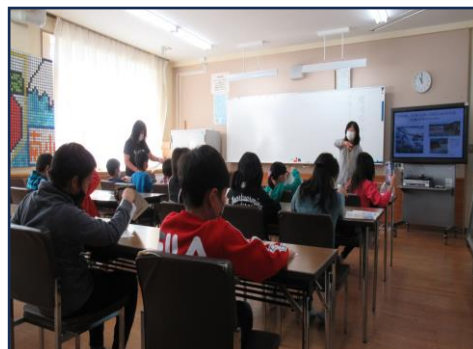
2021年度中道南小学校学習会風景