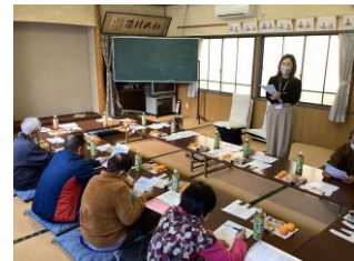
介護予防の普及啓発