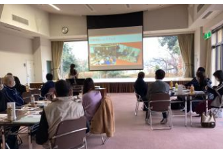
地域の事業所やケアマネジャーとの勉強会