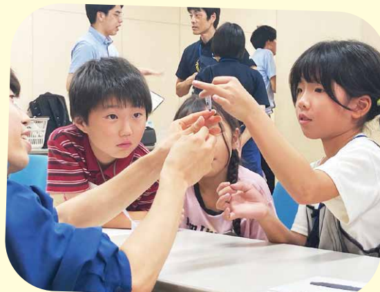
お仕事体験で警察の鑑識に興味津々