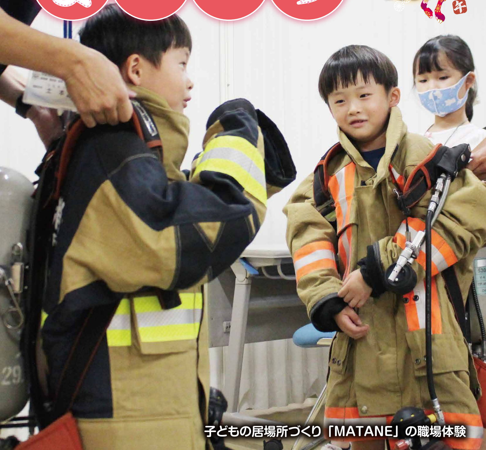
子どもの居場所づくり「MATANE」の職場体験