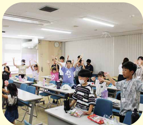
最後はみんなで「またね～」と手を振って

勉強を教えていただいたり、お祭りやゲーム、美味しいお弁当など、子どもが毎回とても楽しみにしていました。学生さんや様々な方との関わりを通して、多くの体験ができたようです。