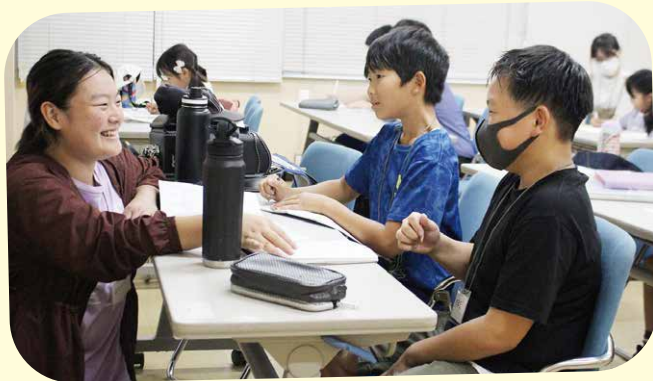
大学生ボランティアと一緒に学習

今年度から新たにスタートした「子どもの居場所づくり」では、夏休み等の長期休暇や放課後に、自宅で過ごす時間が多い子どもが気軽に安心して立ち寄れるフリースペース「MATANE」を開設しました。大学生ボランティアによる学習支援のほか、夏祭りやミニ運動会、eスポーツ大会、お仕事体験など、多彩なイベントを実施しました。地域の大人や学生との関わりを通して、子どもたちの笑顔と元気な声があふれる、にぎやかなひとときとなりました。