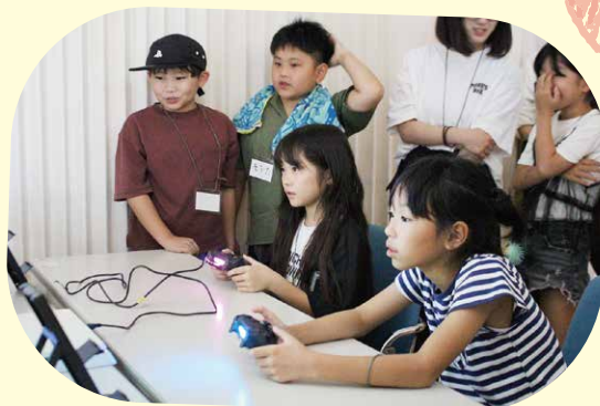
eスポーツで真剣勝負