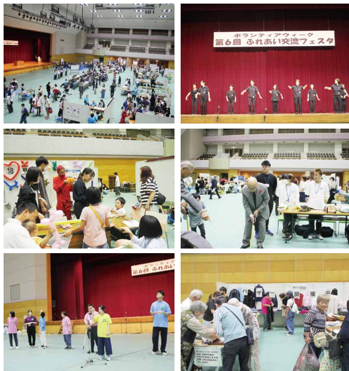
【第6回ふれあい交流フェスタの様子】