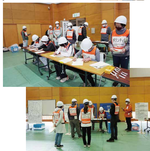
【災害ボランティアセンター運営訓練の様子】