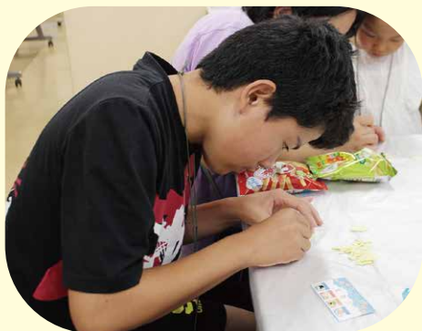
夏祭りの「型抜き」に挑戦！